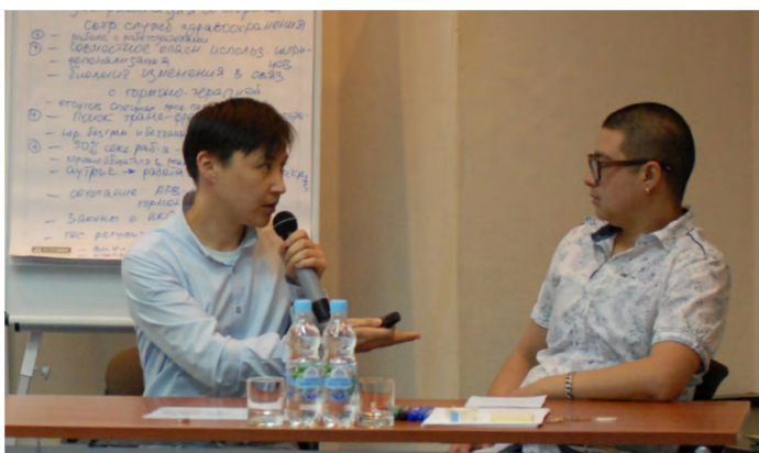
Диалог представителей транс* сообщества ВЕЦА, Киев, 16-17 декабря 2015 г., при поддержке ЕКОМ