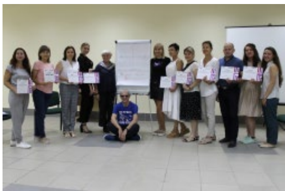
Фото: Участники тренинга «Гендерное равенство и адвокация»

Православной Церкви Украины, которые принимали участие в тренинге, их мнение о гендерной проблематике изменилось — простые примеры из жизни, которые приводились в процессе обучения помогли понять, что слово «гендер» не несет в себе негативного контекста, лишь обросло стереотипами и заблуждениями.