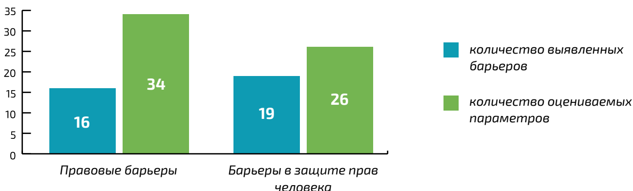
Барьеры в Узбекистане, с которыми сталкиваются ЛГБТ люди

В результате дискриминационное репрессивное законодательство привело к тому, что у ЛГБТ-людей нет эффективных инструментов защиты, и совершать преступления на почве ненависти в отношении представителей данной группы можно почти безнаказанно.